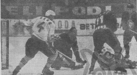
Třetí utkání semifinálové série mistrůvství ČSSR rozhodli ve svůj prospěch kladečtí hokejisté a získali ve sedmém utkání s komárou již druhé vítězství. Na snímku je jedna z rukoucí střelců před brankou Nádrchala. Tentokrát se mu však s pomocí obránců bránců podařilo zabránit.